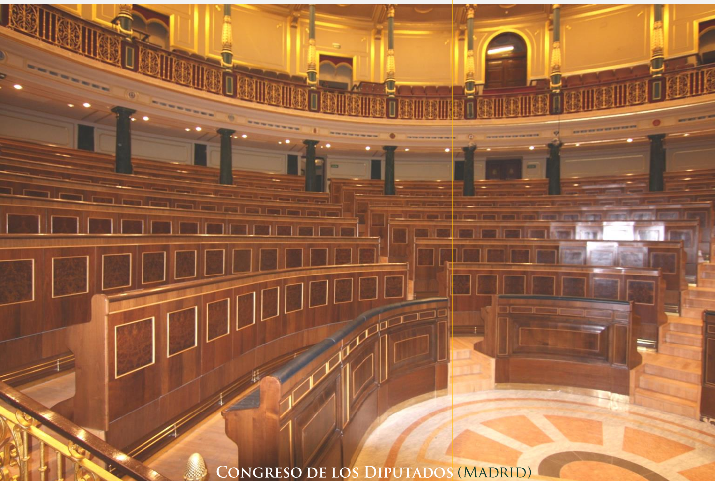
CONGRESO DE LOS DIPUTADOS (MADRID)

Nos apasiona el diseño de elementos arquitectónicos con piedra natural. Contamos con expertos en el arte de la cantería y hemos realizado importantes trabajos de detalle en mármol y otras piedras. Estamos especialmente orgullosos de haber realizado recientemente el suelo y el mosaico central del Congreso de los Diputados en Madrid.